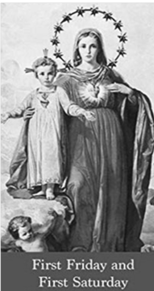
First Friday and First Saturday

“I will come in the hour of death with graces necessary for salvation to all those who for 5 months in the first Saturdays celebrated confession, receive holy communion, recite the rosary and meditate for fifteen minutes on the mysteries of the rosary - will accompany Me to atone for our sins”.