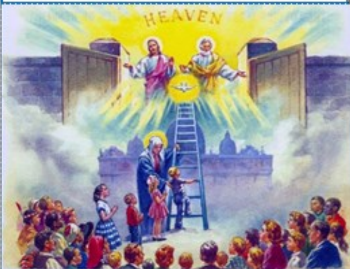
The Church Is Our Ladder to Heaven

Nie wszyscy święci dobrze zaczęli ale wszyscy dobrze skończyli św. Jan Maria Vianney