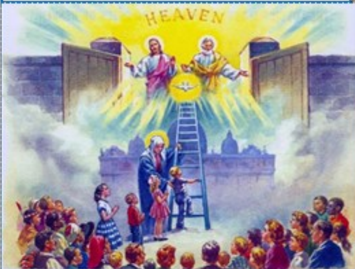
The Church Is Our Ladder to Heaven

Oblady, Przystawki, Wiejski Stół, Ciasta, Torty